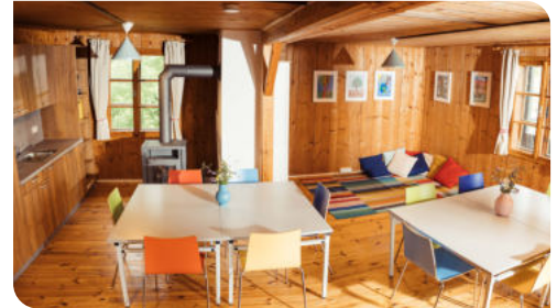
Gemütlicher Seminarraum mit Teeküche