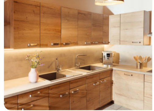
Voll ausgestattete moderne Küche